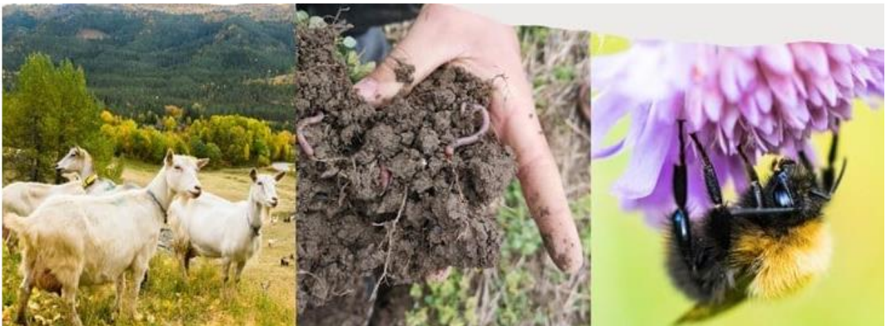
Geiter på beite i Leveld i Ål og humle på rødknapp. Meitemark i jord.