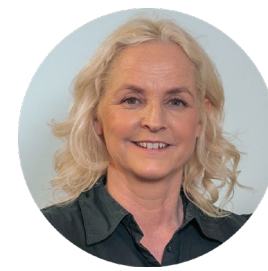
Enhetsleder familie og forebygging

7 skoler/SFO Rømskog Bjørkelangen Aursmoen Løken Bråte Haneborg Setskog Voksenopplæring