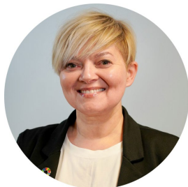
Kommunalsjef Oppvekst og inkludering