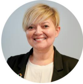
Kommunalsjef Oppvekst og inkludering