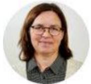
Oppvekststab og pedagogisk tjeneste