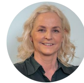
Enhetsleder familie og forebygging

Skoler/SFO Rømskog Bjørkelangen Aursmoen Løken Bråte Haneborg Setskog Voksenopplæring