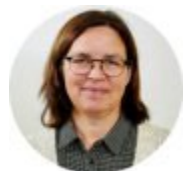
Oppvekststab og pedagogisk tjeneste